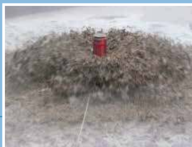
Aeratore di superficie tipo AGV installato in impianto di depurazione Surface aerator type AGV installed in a wastewater treatment plant