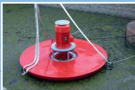
Aeratore di superficie tipo AGV Surface aerator type AGV