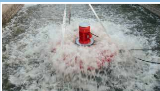
Aeratore di superficie tipo AGV in funzione Working surface aerator type AGV