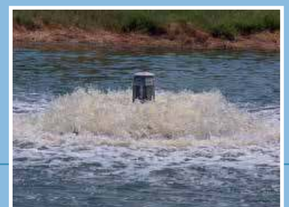
Aeratore di superficie tipo AGV installato in lago artificiale Surface aerator type AGV installed in an artificial lake