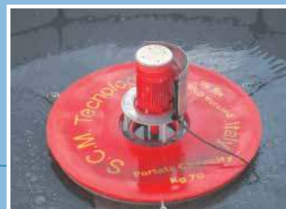
Aeratore di superficie tipo AGV Surface aerator type AGV