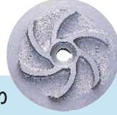
מאיץ לדגם SSM

משאבות שפכים בעלות מאיץ VORTEX, המתכונן לעבודה במגע מינימלי עם החומר הנשאב. דגמי SMA/SSM מצוידים באטם מכני כפול סיליקון / קרבייד קרמיקה / פחם - טבול באגן שמן. המשאבה והמאיץ עשויים יציקת ברזל, המנוע בתוך שרוול קירור נירוסטה אטום.