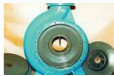
מוצר לאחר ציפוי