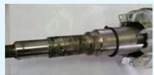
ציר לפני חריטה