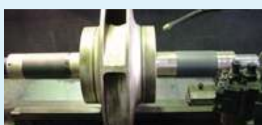
שיחזור תושבות של אטמים מכנים בציר של משאבות גוף חצוי