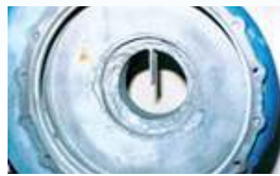
מוצר לאחר ניקוי חול (מוכן ליישום)