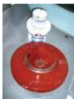
ציפוי מאיץ חדש להגנה מפני קורוזיה/שחיקה וכן להגברת יעילות הידראולית