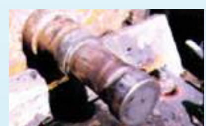
לפני שיחזור ציר