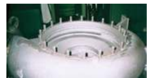
ניקוי חול (הכנה לציפוי)