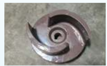
מאיץ חדש אחרי ציפוי קרמי