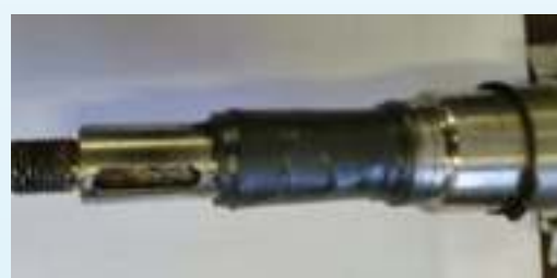
ציר מצופה לפני חריטה