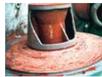
לאחר ניקוי חול וציפוי פנימי