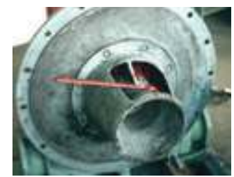
לאחר ניקוי חול