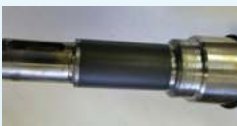
ציר מצופה לאחר חריטה (מוכן)