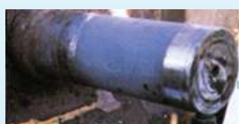
לאחר שיחזור ציר