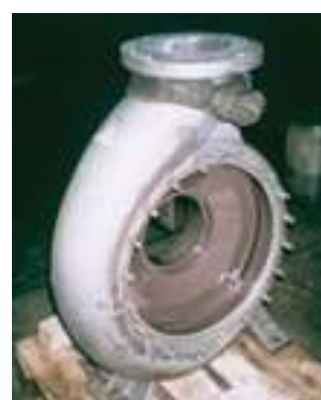
לאחר ניקוי חול וציפוי