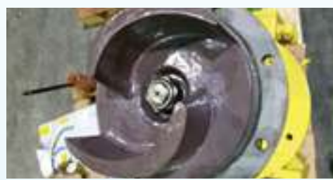
מאיץ עם ציפוי מורכב על המשאבה