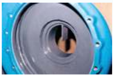
מוצר לאחר יישום חומר EG וציפוי סופי FG