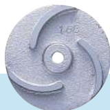
מאיץ לדגם SF/SFA

משאבות ניקוז למים נקיים ודלוחים, לספיקות בינוניות וגבוהות. דגמי SF/SFA מצוידים באטם מכני כפול פחם קרמיקה - טבול באגן שמן. המשאבה והמאיץ עשויים יציקת ברזל, המנוע בתוך שרול קרור גירוסטה אטום.