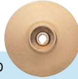
מאיץ לדגם SH

משאבות ניקוז למים נקיים ודלוחים, מיועדות לעבודה בלחצים גבוהים (עומד גבוה). דגמי SHT מצוידים באטם מכני כפול סיליקון/סיליקון טבול באגן שמן. המשאבה עשויה יציקת ברזל, המנוע והמאיץ, ברונזה בתוך שרוול קירור נירוסטה אטום.