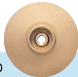
מאיץ לדגם SH

המשאבה עשויה יציקת ברזל, המנוע והמאיץ, ברונזה בתוך שרוול קירור נירוסטה אטום.