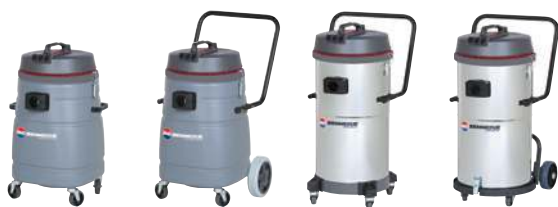
SP 70 (3/4 HP) SP 70 T (3/4 HP) SM 70 (3/4 HP) SM 70 B AC (3/4 HP)