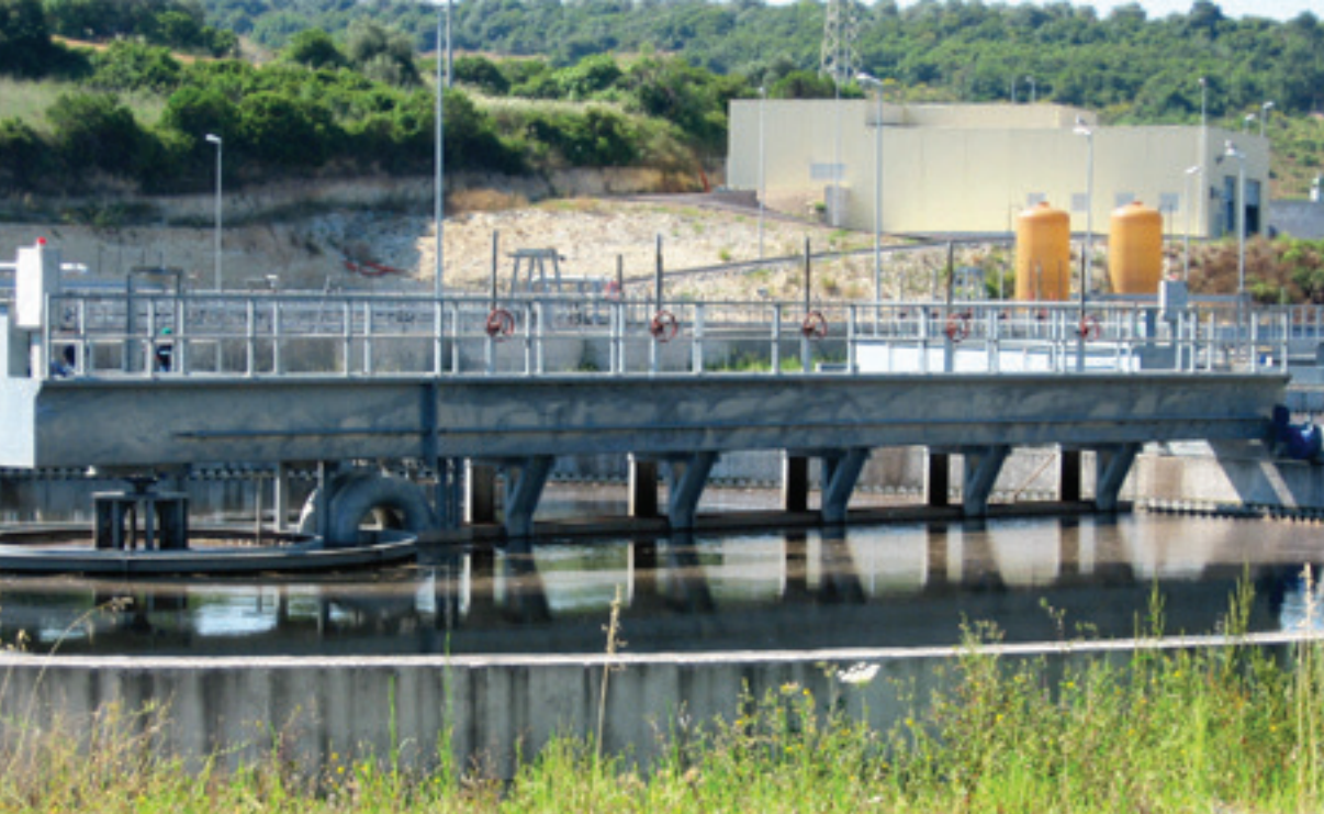
05-091 Ponte sedimentatore circolare aspirato a trazione periferica.

Peripheral drive aspirated bridge for circular clarifier.