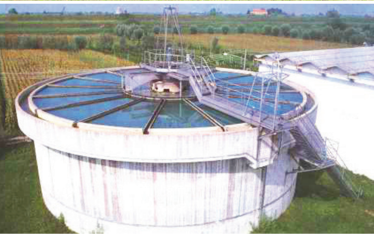
05-094 Chiariflocculatore a trazione centrale per impianto di potabilizzazione.

Peripheral drive aspirated bridge for circular clarifier.