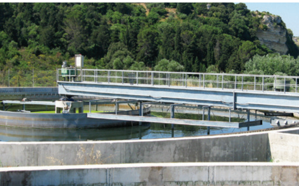
05-094 Chiariflocculatore a trazione periferica con agitatori a cancello centrale.

Central drive clariflocculator for drinking water plant